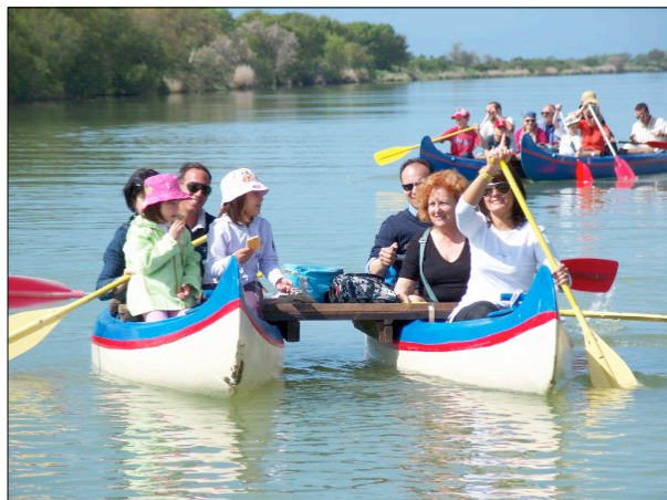
Escursione in canoa